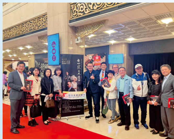
113. 4. 18參加根除小兒麻痺慈善音樂會